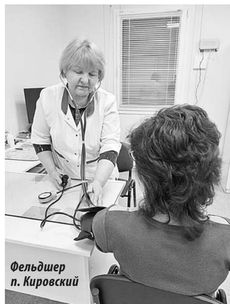
Фельдшер п. Кировский