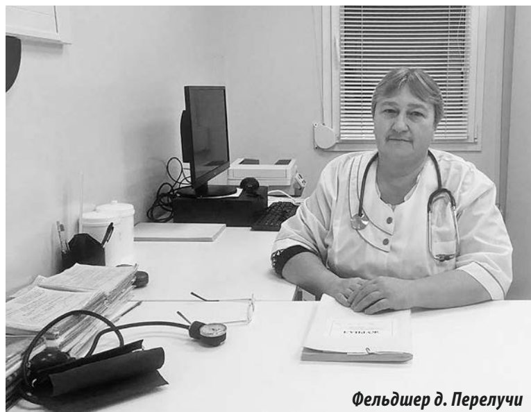
Фельдшер д. Перелучи